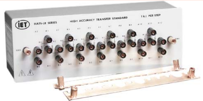
Model HATS-LR-10 Transfer Standard with HATS-LR-SB shorting bars

HATS-LR-10K 10 kΩ/step Transfer Standard HATS-LR-100K 100 kΩ/step Transfer Standard HATS-LR-SB Shorting bars for HATS-LR units HATS-LR-PC Parallel Compensation Network HATS-LR-SP Series-Parallel Compensation Network OPTIONS - RM Rack mountable case for standard 19" rack