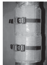
▲アララ パイプシールド