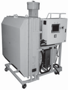
▲放射線ヨウ素捕集装置 中部電力㈱共同開発