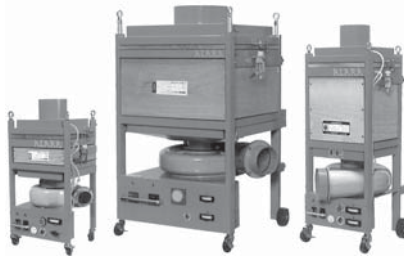
JER-05S (ミニ) JER-2C (ジャンボ) JER-1S ▲アララベンチレータシリーズ