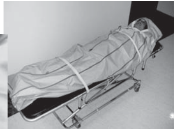
←(財)原子力安全研究協会殿製作ビデオ 「被ばく・汚染傷病者のプレ・ホスピタルケア」より