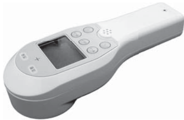
▲アララサーベイ 東京パワーテクノロジー㈱殿共同開発