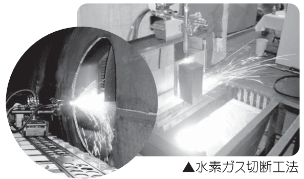
▲水素ガス切断工法